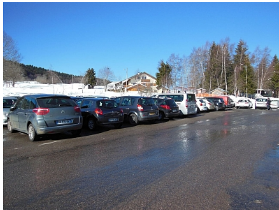
Office de Tourisme des Alpes du Léman

En hiver stationnement autorisé sauf week-ends et périodes de vacances scolaires (parking complet) Si complet aller au parking 800 m plus haut, au col du Cou, ou sur la place au coeur du village, gratuit. Se renseigner à l'office du tourisme.