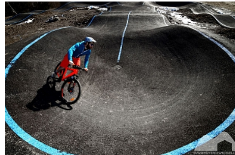
Foyer des Moises